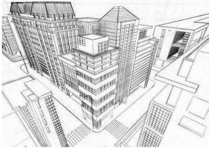
Perspectiva Área. (3 puntos de fuga )