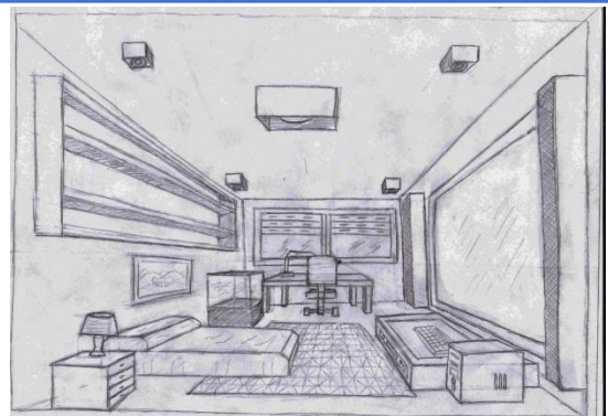
Perspectiva paralela. ( 1 puntos de fuga )